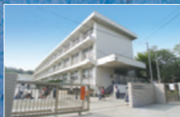
腰越小学校・・・約630M 徒歩約8分。小学校がこの距離なら毎日安心して送り出せます。