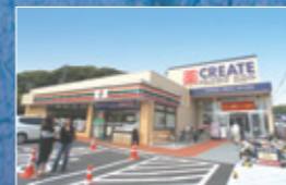
セブンイレブン・クリエイト・・・約760M 徒歩約10分。コンビニ・ドラッグストアが隣接し、ちょっとした買い物から生活雑貨・医薬品まで何でも揃います。