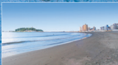
腰越海水浴場・・・約630M 海岸まで約8分の好立地。腰越漁港の隣に位置し、目の前には湘南のシンボルとしても有名な江の島が一望できます。