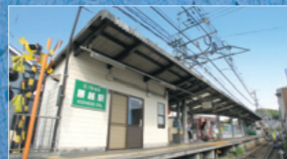
腰越駅・・・約450M 駅まで約6分の好立地。通勤や通学など、とても便利です。