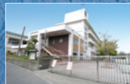
腰越中学校・・・約440M 徒歩約6分。中学校がこの距離なら毎日安心して送り出せます。